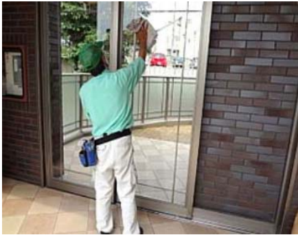
窓やガラスの清掃