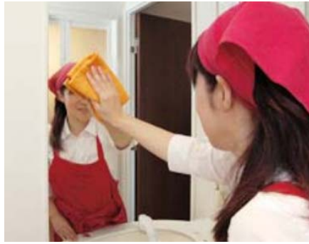
鏡もきれいになります