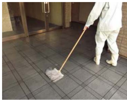
タイルなどのフローア