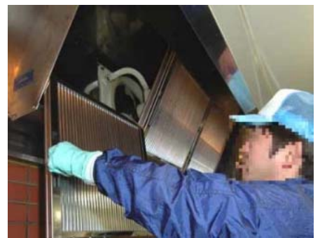
換気扇、レンジフード